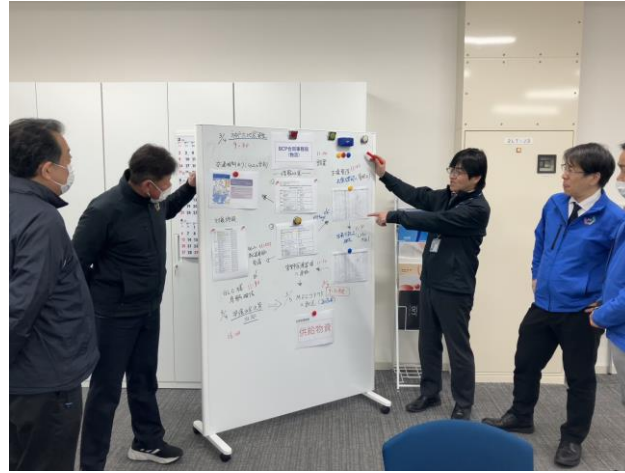
③支援体制・の検討