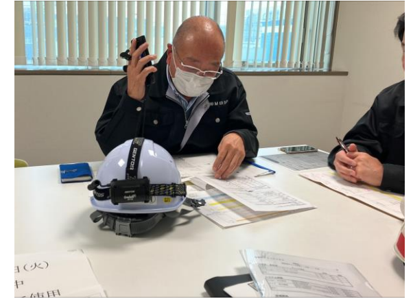
④八神製作所への支援依頼