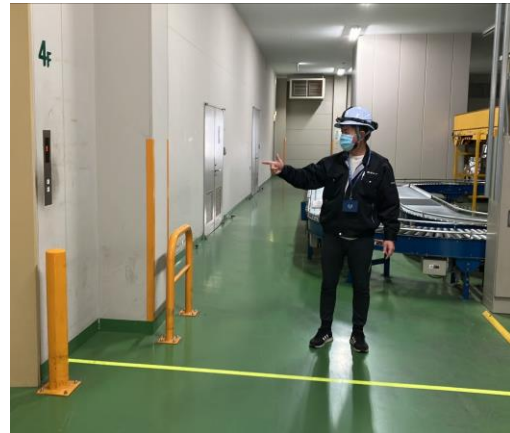
②倉庫内の確認(被災状況)