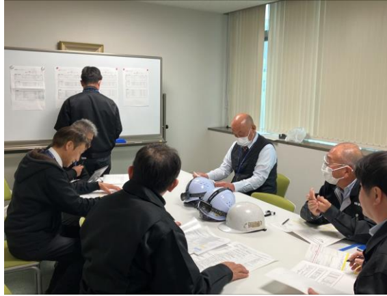
①BCP合同事務局の設置