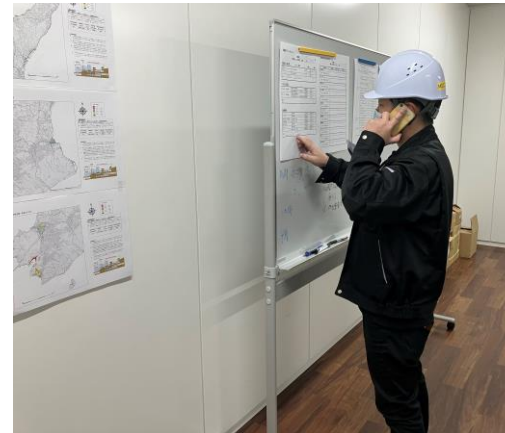
③安否確認&情報収集