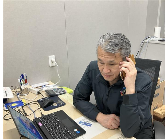
②宮野医療器からの支援要請を受ける