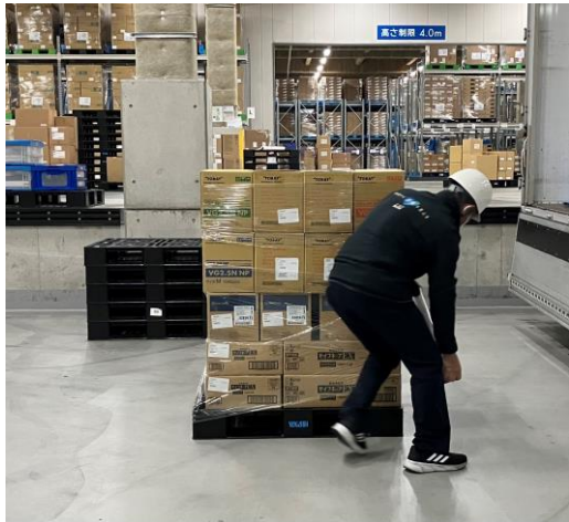
⑤検品&パレタイズ作業