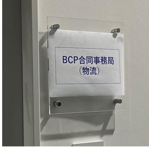
①BCP合同事務局の設置