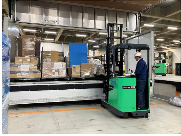
⑦トラックへの積み込み作業