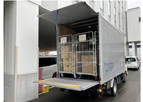
⑧お客様(病院様)への納品

今後も継続した訓練活動を行い、災害時の相互支援体制を整備・強化することで、お客様への医療機器の安定供給と両社の事業継続力の強化を実現していきます。