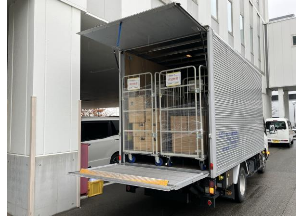
⑧お客様(病院様)への納品

今後も継続した訓練活動を行い、災害時の相互支援体制を整備・強化することで、お客様への医療機器の安定供給と両社の事業継続力の強化を実現していきます。