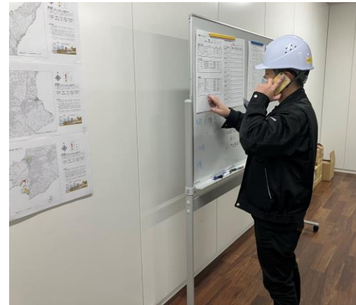
③安否確認&情報収集