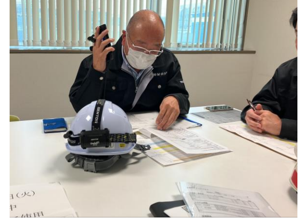
④(株)八神への支援依頼