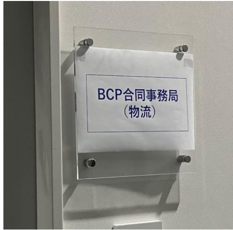
①BCP合同事務局の設置